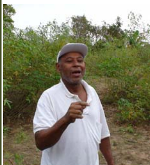
Mobilização do pólo Cuiabá e Adjacências no Assentamento Dorcelina Folador, em Várzea Grande.

“As ações do PROFOR 163 são executadas por cinco pólos regionais, sendo dois em Mato Grosso e três no Pará”